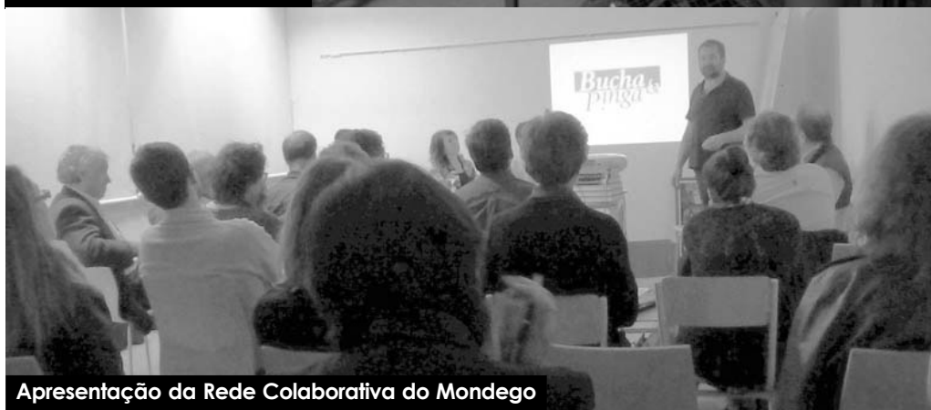
Apresentação da Rede Colaborativa do Mondego

de qualidade, em vários casos associados a pequenos e médios produtores. Antes de ser rede, a RCM começou por ser uma ‘parceria colaborativa’, desenvolvendo-se depois a abrangência do projeto com a assinatura de protocolos, envolvendo formas articuladas de produção, promoção e comercialização (incluindo mutualismo no trabalho, quanto à venda). Foram dados exemplos de “produtos do Mondego” (com o apoio de parceiros presentes na sessão), que são divulgados como produtos turísticos, promovendo-se a sua venda e consumo de modo contextualizado, ou seja, no terri-