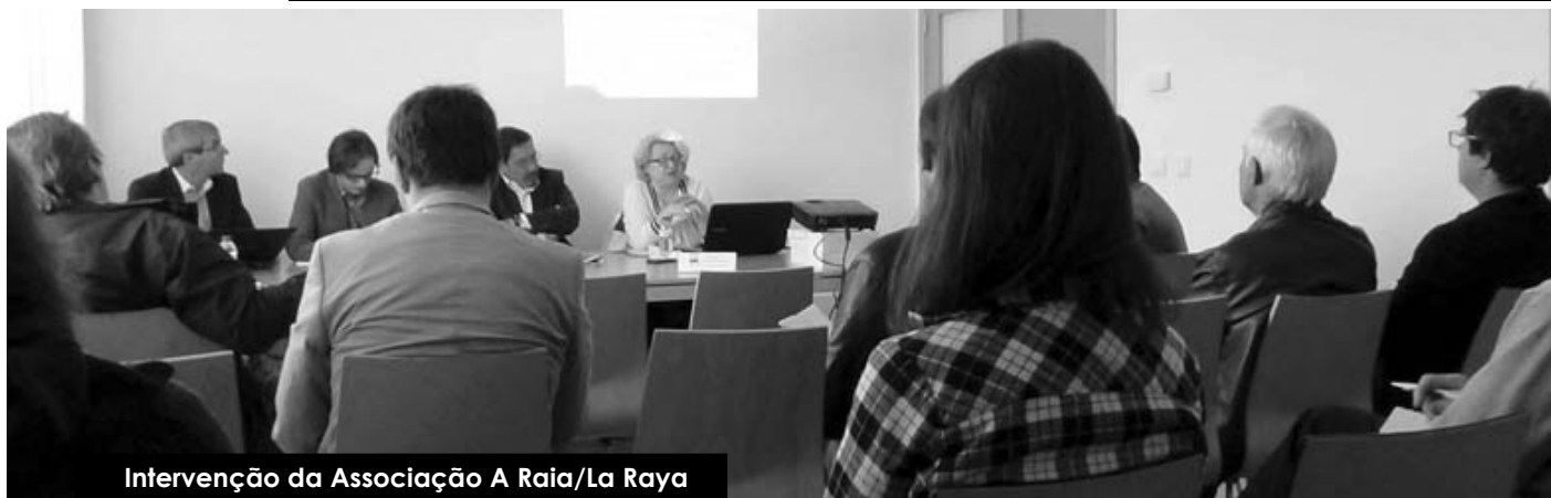
Intervenção da Associação A Raia/La Raya

Finalmente, a Oficina Cooperação Internacional e o Desenvolvimento dos Territórios deixa seis sugestões para melhorar as práticas e os resultados da cooperação. Nesta linha há necessidade de: