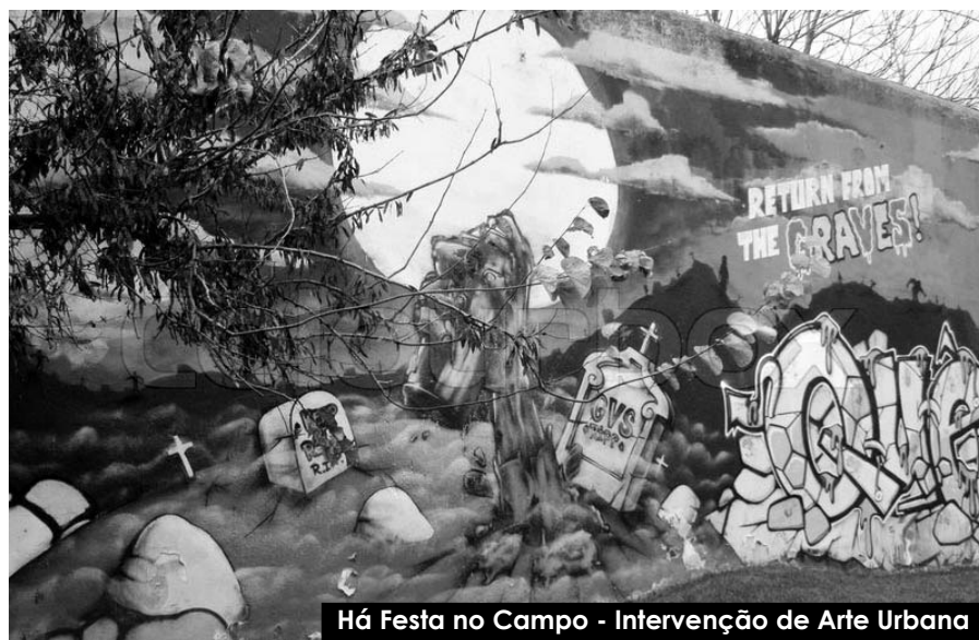
Há Festa no Campo - Intervenção de Arte Urbana

A participação e capacitação da comunidade passa por se acreditar