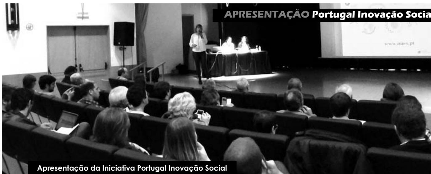
Apresentação da Iniciativa Portugal Inovação Social