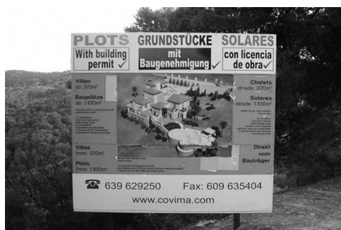
Figura 13 – Cartaz de venda de um lote na ilha de Maiorca (Arquipélago das Baleares, Espanha). Aqui, a imagem antecipa a realidade e exerce poder de sedução na criação de novas frentes urbanizadas.

As imagens expostas alteram a paisagem sensorial mas são também instrumentos de promoção de novas frentes imobiliárias que reconfigurarão o espaço geográfico. Como estratégia de venda de lotes ou casas, reproduz-se a futura construção, atribui-se-lhe uma imagem de qualidade, baixa densidade e proximidade à natureza (esta também sugerida pela toponímia de urbanizações, por exemplo, em cujos nomes de identificação abundam termos ecológicos como ‘jardim’, ‘quinta’ ou ‘parque’). Assim se promove, pela sugestão da imagem, a urbanização e privatização dos solos e se dinamiza, orienta e dirige o mercado imobiliário. Com efeito, as representações gráficas nas paisagens urbanas promovem e orientam a mudança mas fixam também o olhar para o que nalguns casos se perdeu e se pretende depois recriar. A (re) descoberta e (re) aproximação à natureza é, em espaços que se vão densificando, uma necessidade simbólica e funcional, que se materializa por espaços verdes antrópicos mas também por representações de uma natureza falsa que, de certo modo, se deseja (Figura 13).