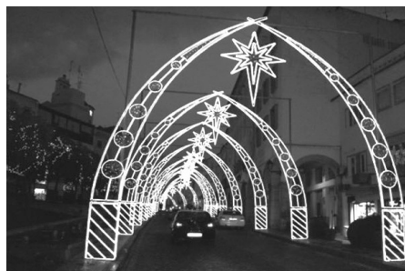
Figura 1 – Pormenores da cityscape de Elvas, em dezembro de 2006: um presépio na Praça da República e iluminação numa das principais artérias do centro histórico, a Rua da Cadeia.