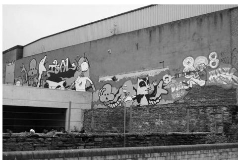
Figura 11 – Grafitti num espaço público de Sheffield (Inglaterra).

Todavia, se as imagens reproduzem lugares e os divulgam, as próprias expressões gráficas criam novas paisagens. Nos espaços urbanos inscrevem-se afirmações simbólicas de grupos que o apropriam, criando uma paisagem iconográfica por vezes de resistência e contracultura, expressa em grafittis que povoam espaços públicos e privados em muitas cidades, sobretudo as culturalmente mais diversificadas (Figura 11).