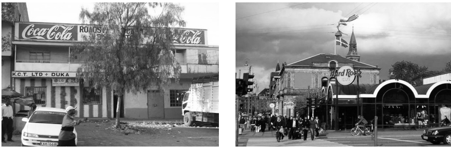
Figura 12 – Marca global na paisagem urbana de Narok, no Quênia; e, num fragmento da cityscape de Copenhaga, um elemento indiferenciado, o símbolo do Hard Rock Café, aqui enquadrado com um outro, este de forte identificação local - a bandeira nacional dinamarquesa.

urbano sofisticado. Estas expressões visuais conferem hibridismo ao espaço urbano, uma cidade-vitrine de espetáculo, sedução e apelo, um espaço público aberto aos interesses privados nos quais se cria riqueza mais pela troca que pelo uso. O hibridismo das paisagens urbanas resulta também da incorporação conjunta de elementos de identidade local e de elementos simbólicos globais, estes últimos sobretudo associados à circulação privada de investimentos, por via de sistemas de mobilidade como o franchising ou pela difusão mundial de símbolos de multinacionais, responsáveis por parte importante da iconografia da paisagem, em espaços urbanos de rankings demográficos e económicos muito diversificados (Figura 12).