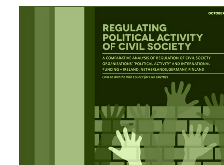
REGULATING POLITICAL ACTIVITY OF CIVIL SOCIETY por CIVICUS E IRISH COUNCIL FOR CIVIL FOR CIVIL LIBERTIES em 2018 língua INGLÊS

Desde 2005, a CONCORD publica o Relatório anual AidWatch, para monitorizar a qualidade e quantidade da ajuda ao desenvolvimento da UE. A Edição deste ano - AidWatch 2018 “EU Aid: A Broken Ladder?” - revela que pela primeira vez em cinco anos a Ajuda Pública ao Desenvolvimento (APD) da União Europeia (UE) diminuiu em 2017. O relatório alerta que, à taxa de crescimento atual, a EU precisaria de mais 40 anos para cumprir a meta de 0,7% do Rendimento Nacional Bruto (RNB) para a APD.