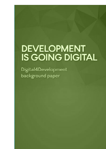
DEVELOPMENT GOING DIGITAL? por CONCORD EUROPE E FOND ROMANIA em 2018 língua INGLÊS

Esta publicação, apresenta uma análise comparativa da regulação da “atividade política” das organizações da sociedade civil e do financiamento internacional na Irlanda, Holanda, Alemanha e Finlândia, concentrando-se particularmente em organizações de direitos humanos, que realizam atividades de defesa pública e dependem de fontes internacionais para uma parcela substancial de seu financiamento.