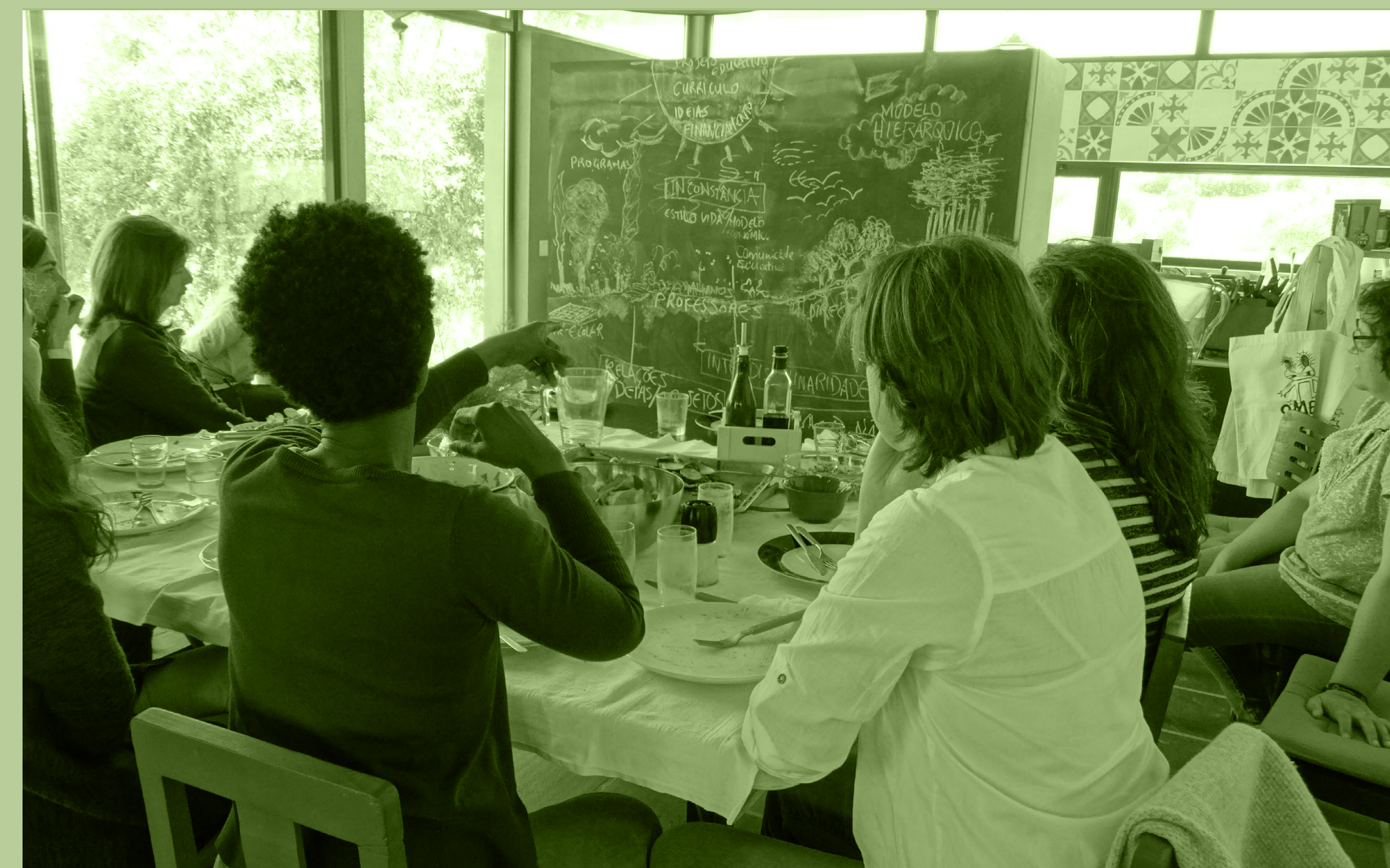
PROJETO CAUSA COMUM. FUNDAÇÃO GONÇALO DA SILVEIRA.