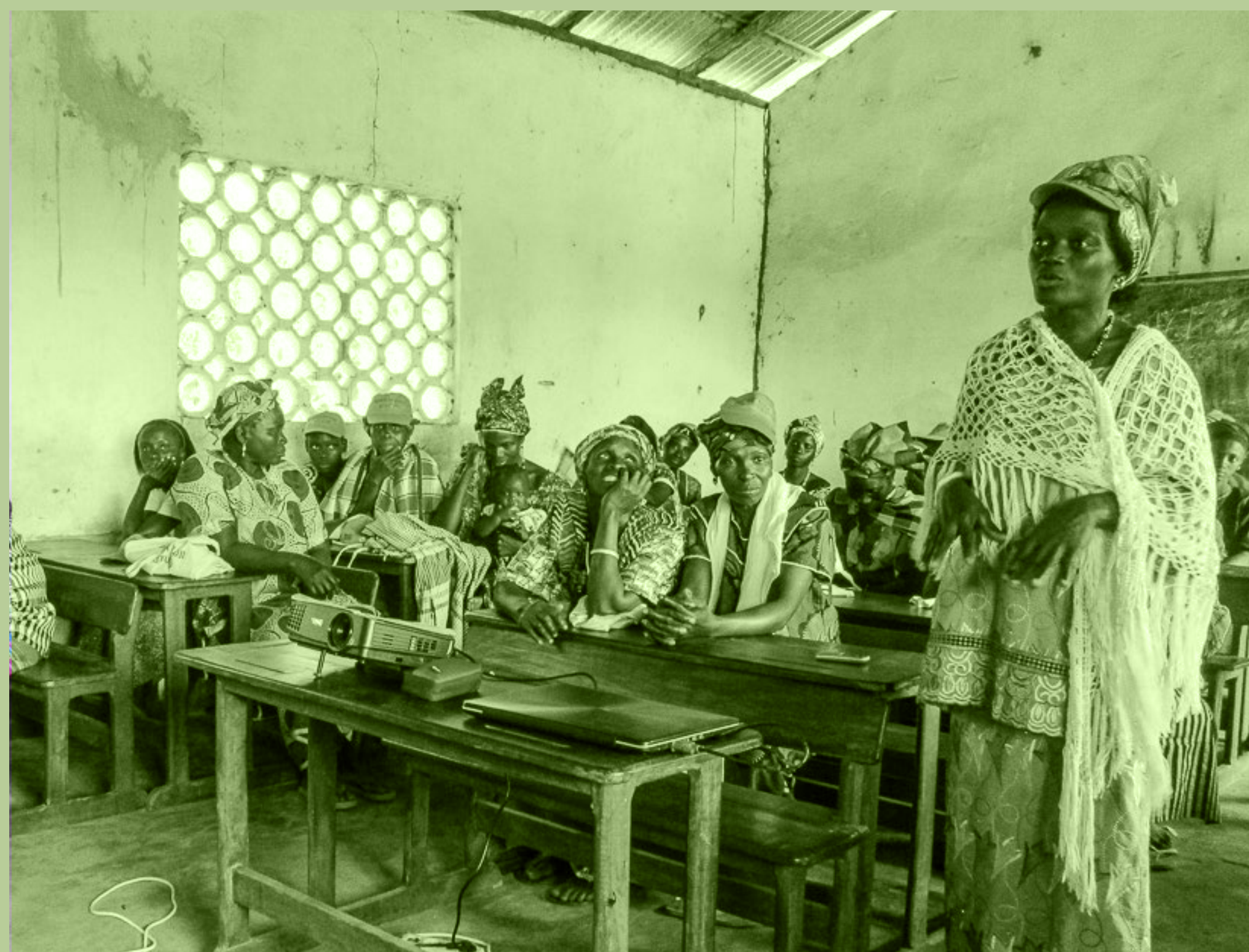
"KÓPOTI PA CUDJI NÓ FUTURO" - PROJETO DE DESENVOLVIMENTO RURAL E SEGURANÇA ALIMENTAR IMPLEMENTADO PELA VIDA. GUINÉ-BISSAU.

VIDA - VOLUNTARIADO INTERNACIONAL PARA O DESENVOLVIMENTO AFRICANO