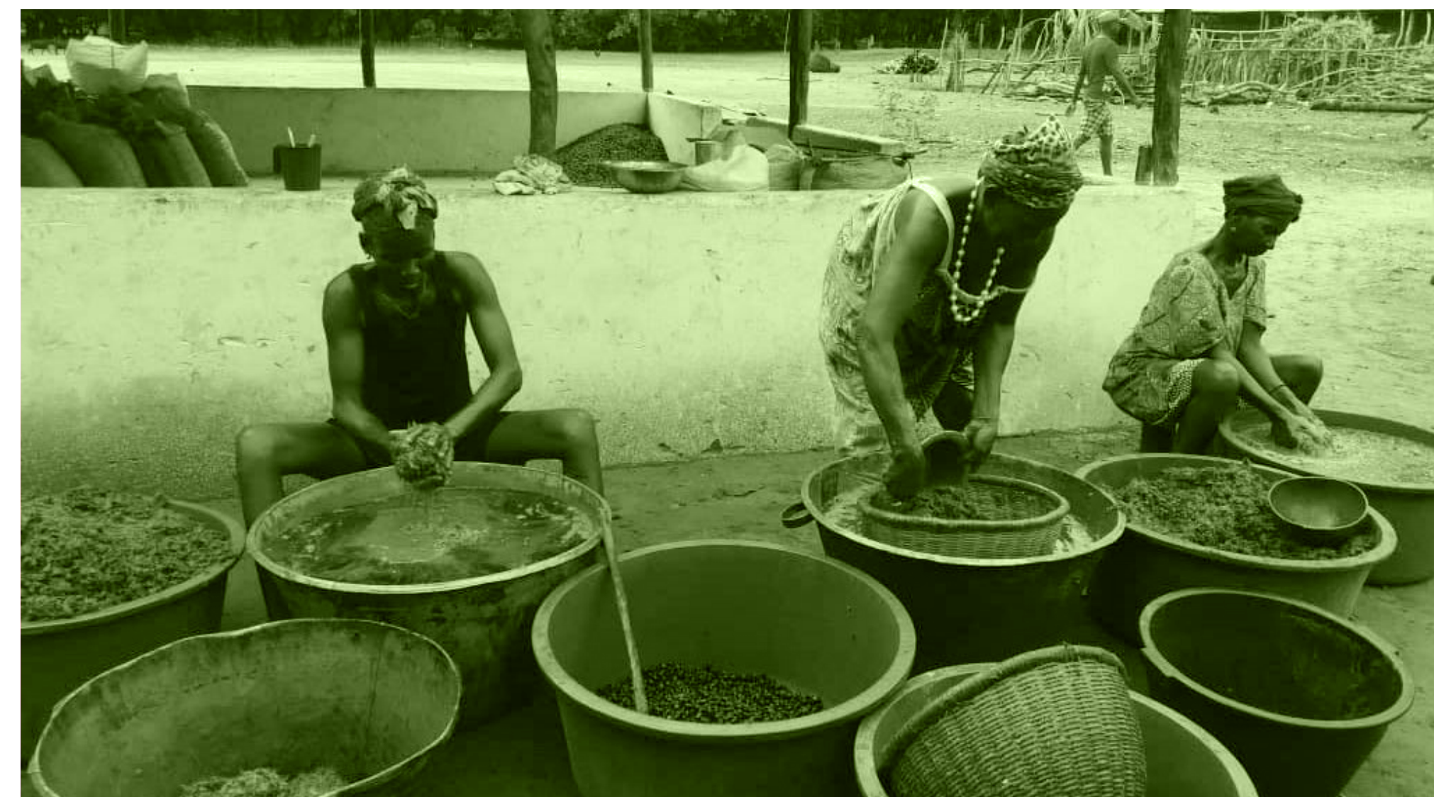
NO KUME SABI. GUINÉ-BISSAU.

“Que teu alimento seja teu remédio e teu remédio seja teu alimento.” Hipócrates