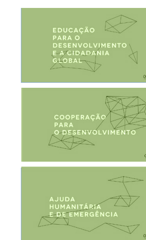
FICHAS TEMÁTICAS DA PLATAFORMA por PLATAFORMA PORTUGUESA DAS ONGD em 2018 língua PORTUGUÊS

O relatório “The State of Food Security and Nutrition in the World 2018” monitora o progresso em direção às metas dos ODS relativas à fome e à desnutrição e fornece uma análise das causas subjacentes às tendências observadas. Este relatório conclui que o número de pessoas que sofrem com a fome no mundo aumentou nos últimos três anos, retornando aos níveis de quase uma década atrás. O relatório confirma ainda que a as alterações climáticas são os principais impulsionadores deste aumento, juntamente com conflitos e crises económicas.