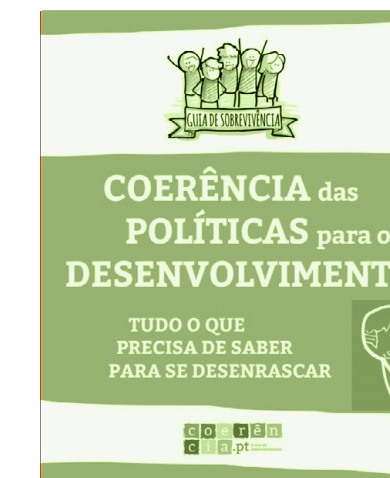
GUIA DE SOBREVIVÊNCIA EM COERÊNCIA DAS POLÍTICAS PARA O DESENVOLVIMENTO por MÓNICA SANTOS SILVA em 2018 língua PORTUGUÊS

O que significa digitalização? Qual o seu impacto no setor de desenvolvimento? Reforçará ou enfraquecerá os objetivos de desenvolvimento? Qual transformações devemos esperar? O novo relatório “Development Going Digital?” da CONCORD Europe e FOND Romania, analisa as principais tendências digitais e os impactos da digitalização na agenda de desenvolvimento, bem como explora os papéis e as oportunidades para as organizações da sociedade civil neste novo ambiente.