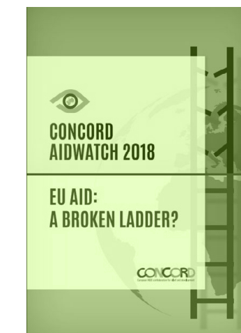
CONCORD AIDWATCH 2018 por CONCORD EUROPE em 2018 língua INGLÊS

Saiba mais sobre a campanha #GoodFood4All