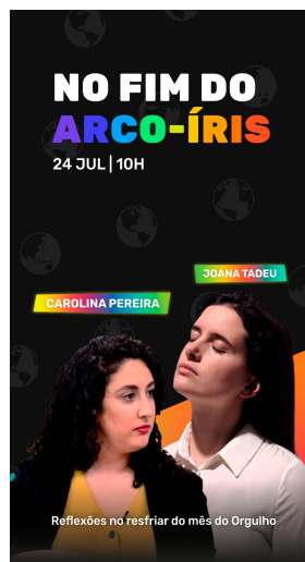
No Fim do Arco-Íris