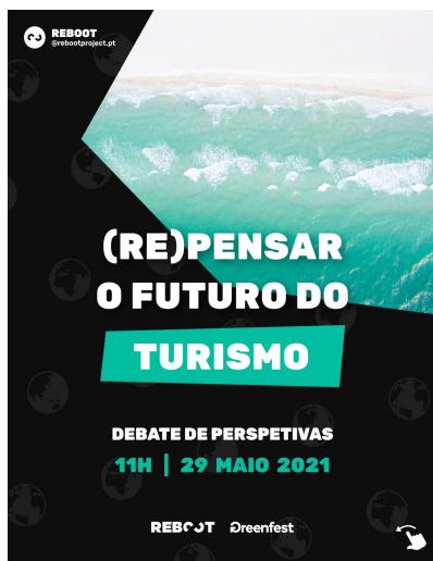
(Re)Pensar o Futuro do Turismo

O Circular 2021 foi o nosso grande evento de dia inteiro na Aula Magna (Universidade de Lisboa), com 19 oradores e +300 participantes. Igualmente, obteve uma avaliação média de 8.4 numa escala de 0-10 pelos participantes e 4.8 numa escala de 0-5 pelos oradores.