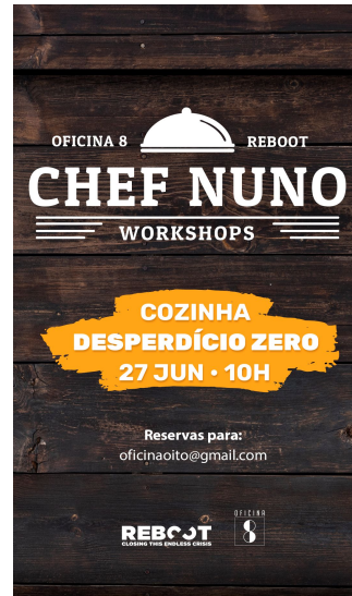
Cozinha Desperdício Zero